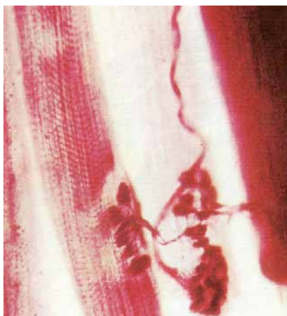
Figuur 1: Een elektrische impuls wordt ter hoogte van het contact tussen zenuw en spiercel getransformeerd in een chemische stimulus

Het chronisch vermoeidheidssyndroom (CVS) wordt vooral gekenmerkt door een enorme vermoeidheid in de spieren. Fibromyalgie (FM) en spasmofilie (SF) zijn uitingen van een abnormale prikkel ter hoogte van de neuromusculaire overgang (cfr. Figuur 1). Ter hoogte van dit contactpunt tussen zenuw en spiercel wordt elektrische zenuwcelenergie getransformeerd in chemische spiercelenergie zodat men normaal actief kan functioneren. Zij die lijden aan fibromyalgie (FM) ervaren aanhoudende gespannen en pijnlijke spieren over het ganse lichaam. Spasmofilie (SF) wordt dan eerder getypeerd door intense spierkrampen . De andere geassocieerde klachten van CVS, FM en SF zijn zeer vaak gelijklopend (cfr. Schema).