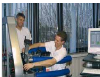
Zijdelings buigen links/rechts