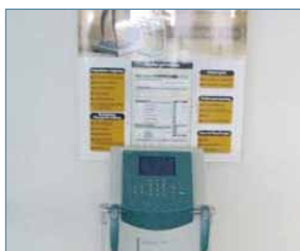
Analyse van lymfedrainage

Voor de analyse van de vier vernoemde elementen, werden onderstaande apparaten gebruikt