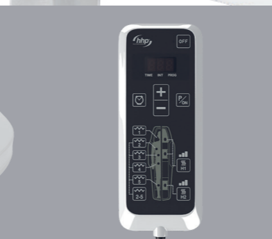
COMMANDE MANUELLE Commande manuelle avec écran LED et 20 programmes différents.