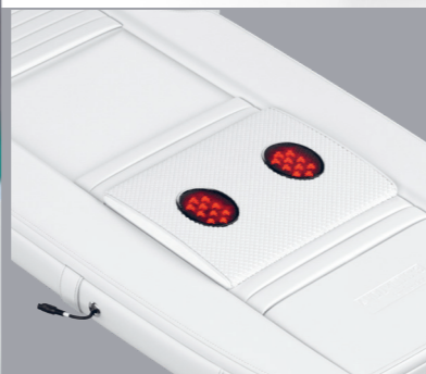
COUSSIN DES PIEDS Zones réflexologiques plantaires, les pieds sont placés un peu plus haut.