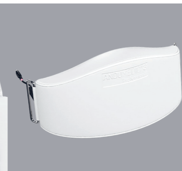
BELT ANDULATOR Ceinture ventrale favorable pour la digestion et les muscles abdominaux.