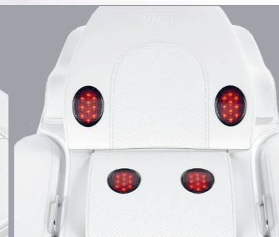
COUSSIN POUR LE CŒU Chaleur infrarouge brevetée qui se concentre sur la nuque et le dos.