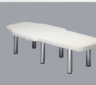
SOMMIER Le sommier en option s'adapte parfaitement à votre ANDUMEDIC Pro.