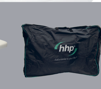
SAC DE TRANSPORT L'ANDUMEDIC Pro est facile à emporter grâce au sac de transport en option.