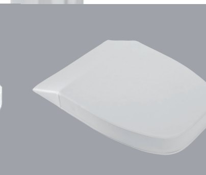
COUSSIN DE POSITION Pour une position ergonomique idéale.