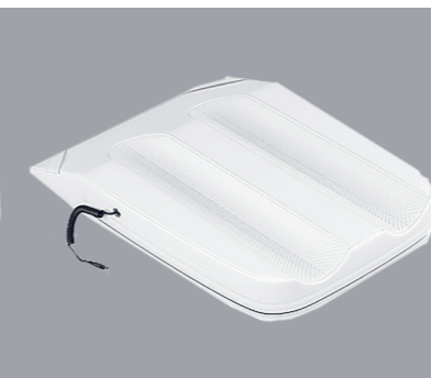
POWER ANDULATOR Soutien supplémentaire pour les jambes.